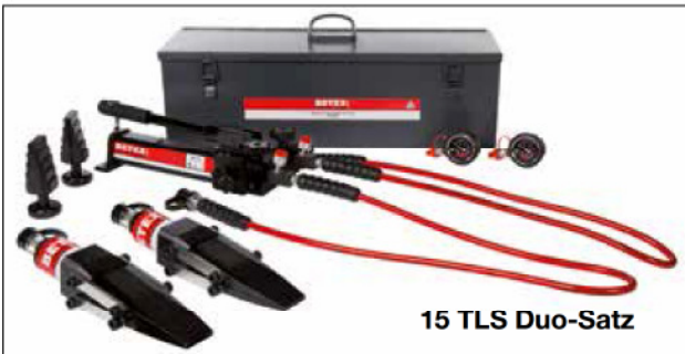
15 TLS Duo-Satz