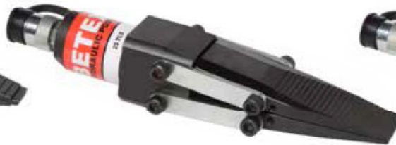
25 TLS Keil- Spreizzylinder