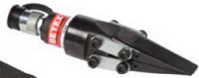
15 TLS Keil- Spreizzylinder

Diese patentierte Spezialwerkzeuge sind einfach und sehr praktisch. Sie können mit grosser Genauigkeit und Komfort Spreizen und Heben beispielsweise Motoren, Getriebe, Flansche, usw.