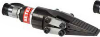
15 TL Spreizzylinder