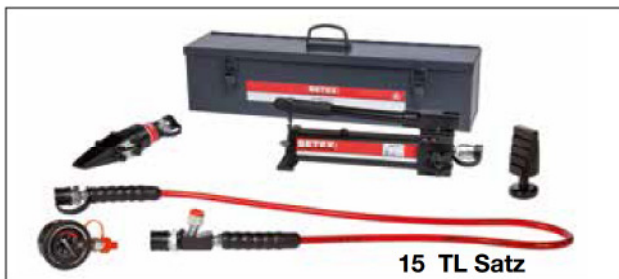
15 TL Satz