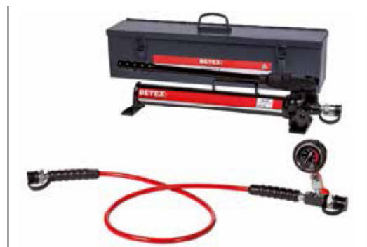
Combi-Satz PB 700