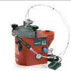
97009 / 97121 / 97201

Das Halbautomatische LOCTITE Dosiersystem ist eine integrierte Konstruktion von Steuergerät und Tank für die Dosierung von vielen LOCTITE Schraubensicherungen mit Hilfe von Ventilen. Mit digitaler Zeitsteuerung, Leermeldung und Fertigmeldung. Quetschdosierventil für die Dosierung im Handbetrieb oder als stationäres System. Die Tanks sind groß genug für die Aufnahme von 2-kg-Flaschen und die Geräte können mit einer Füllstandsüberwachung ausgerüstet werden.