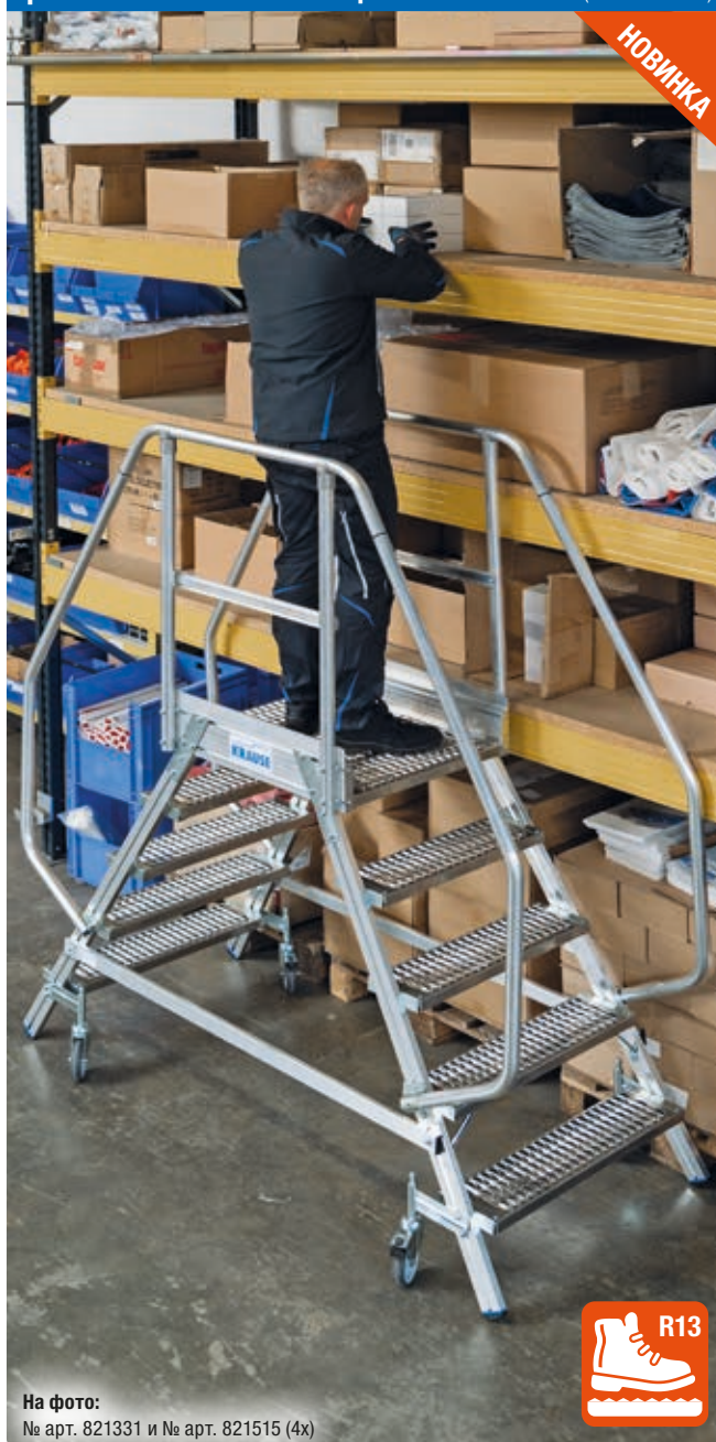
На фото: № арт. 821331 и № арт. 821515 (4х)