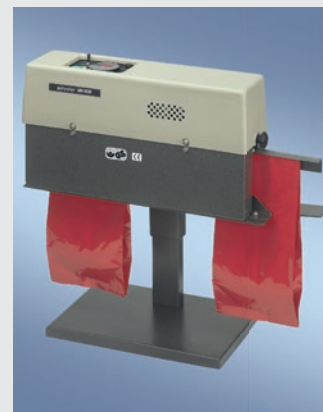
400 DSM-H MIT TISCHSTÄNDER

RISCHE + HERFURTH GMBH Maschinen- und Apparatebau Kedenburgstraße 53-59 22041 Hamburg