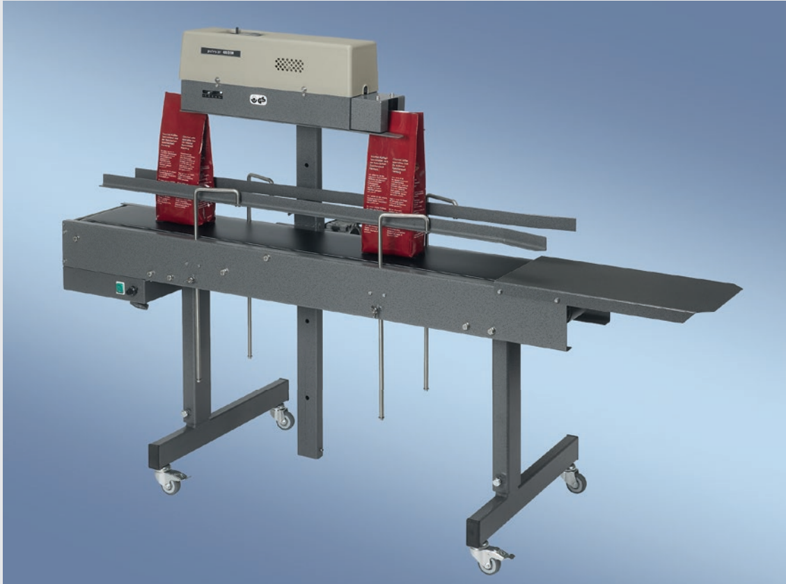
400 DSM-V MIT FAHRBAREM TRANSPORTBAND