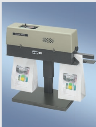
400 DSM MIT TISCHSTÄNDER