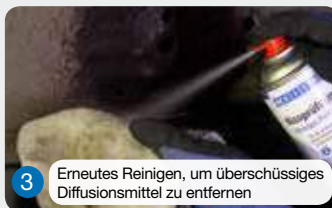
3 Erneutes Reinigen, um überschüssiges Diffusionsmittel zu entfernen