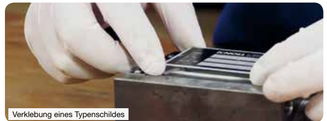
Verklebung eines Typenschildes

WEICON Easy-Mix RK-7200 und RK-7300 sind universell einsetzbar und können beispielsweise im Karosserie- und Fahrzeugbau, im Maschinenbau, im Metallbau, in der Elektrotechnik oder in der Kunststofftechnik verwendet werden.