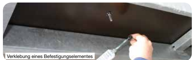
Verklebung eines Befestigungselementes

Hochfeste, schnellhärtende 2-Komponenten Strukturklebstoffe auf der Basis von Polyurethan mit sehr guter Haftung auf den unterschiedlichsten Werkstoffen. Die hochviskose Einstellung ermöglicht die Verarbeitung auch an senkrechten Flächen. Das 2-K.-System sorgt zudem für eine schnelle und kontrollierte Durchhärtung. Das macht den Klebprozess nahezu unabhängig von Schichtdicke, Luftfeuchtigkeit und Umgebungstemperatur.