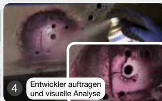
4 Entwickler auftragen und visuelle Analyse

Reiniger, Diffusionsmittel und Entwickler für die zerstörungsfreie Werkstoffprüfung mittels Farbeindringverfahren