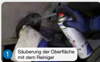
1 Säuberung der Oberfläche mit dem Reiniger