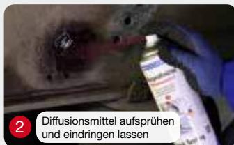
2 Diffusionsmittel aufsprühen und eindringen lassen