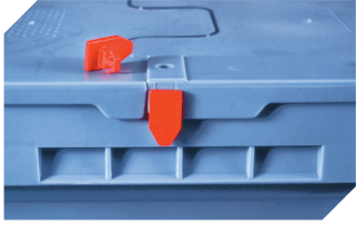
Plomben MBP1 - für BITOBOX MB 6-10810