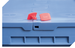
Plomben MBP2-L - für BITOBOX MB, XL, SL 6-19162