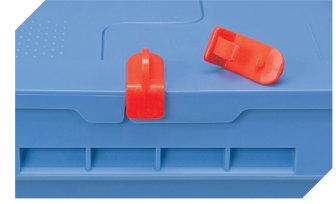
Verschluss-Clips für BITOBOX MB 6-20299