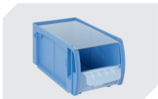
Staubdeckel CSD für C-Teile-Behälter CTB L 269 x B 148 mm 53-31341