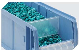
Dosierscheiben CDS für C-Teile-Behälter CTB 53-31304