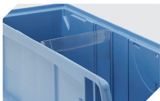
Querteiler CQT für C-Teile-Behälter CTB 53-31303