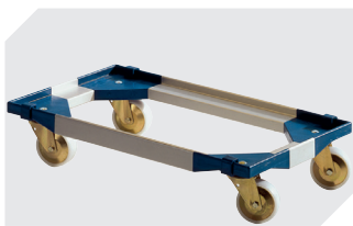
Transportroller für Mehrwegbehälter 800 x 400 mm und 800 x 600 mm L 720 x B 540 mm 6-19439