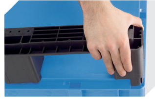
Kufensets für Eurostapelbehälter XL 43-20273