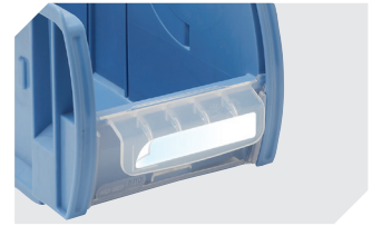
Klebefeldfolien für C-Teile-Behälter CTB 53-31308