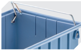
Sicherungs-/Tragebügel für Regalkästen RK und C-Teile-Be- hälter CTB 3-31314