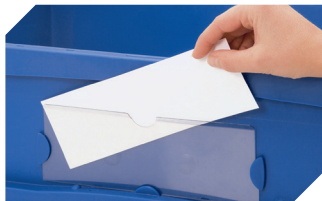
Etiketten für BITOBOX XL und KLT mit einer Mindesthöhe von 170 mm B 210 x H 74 mm 43-14557