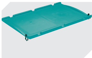
Auflagedeckel einseitig anschnürbar auf Kleinla- dungsträger KLT und Eurostapelbe- hälter XL L 600 x B 400 mm 43-21523