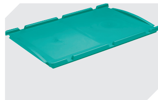
Auflagedeckel für Kleinladungsträger KLT L 600 x B 400 mm 43-20497