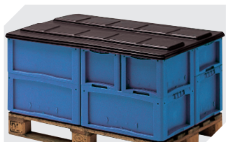
Palettenabdeckhauben L 1220 x B 820 mm 9-18421