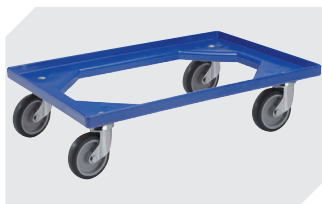
Transportroller Material Rad: Gummi L 620 x B 420 mm 43-21883