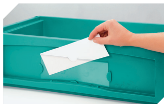
Etikettenabdeckungen für Kleinladungsträger KLT für Eurostapelbehälter XL mit Herausfallschutz B 218 x H 80 mm 9-20054