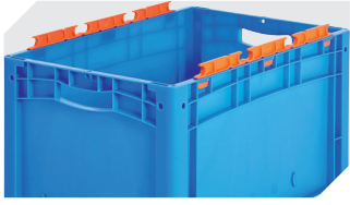
Tütenleisten demonierbar 6-31553