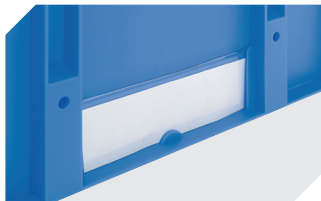
Etikettenabdeckungen für Eurostapelbehälter XL und Kleinladungsträger KLT B 209 x H 67 mm 9-20053