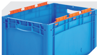
Tütenleisten demonierbar 6-31553