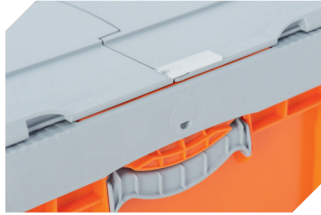
Plomben mit Laserbeschriftung für BITOKLAPPBOX EQ 51-31666