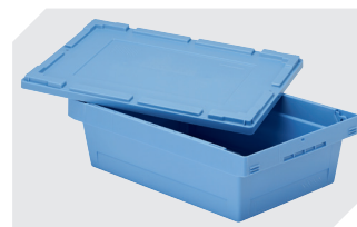
Stülpdeckel für Mehrwegbehälter MB L 800 x B 400 mm 6-22544