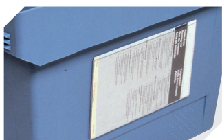
Etikettentaschen selbstklebend 3 Seiten offen L 175 x B 105 mm 6-5031