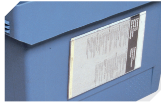
Etikettentaschen selbstklebend 3 Seiten offen L 175 x B 105 mm 6-5031