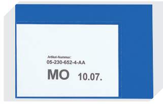
Etikettentaschen selbstklebend 2 Seiten offen L 145 x B 100 mm 46-21108