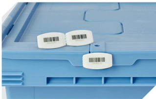
Barcode-Plomben MBP3 - für alle Mehrwegbehälter MB-Größen und XL-Behälter 800 x 600 mm 6-31550