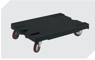
Transportroller für Behälter 800 x 600 mm L 800 x B 600 x H 198 mm 43-1150