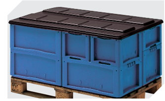
Palettenabdeckhauben L 1220 x B 820 mm 9-18421