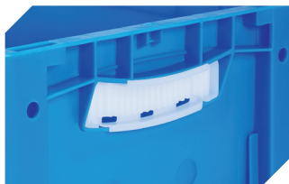
Griffverschlüsse für Eurostapelbehälter XL Höhe 170, 220 und 270 mm 43-31450