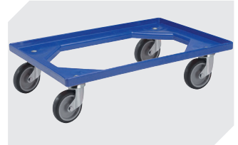
Transportroller Material Rad: Gummi L 620 x B 420 mm 43-21883