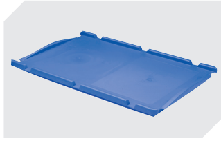
Auflagedeckel für Eurostapelbehälter XL L 600 x B 400 mm 43-20301