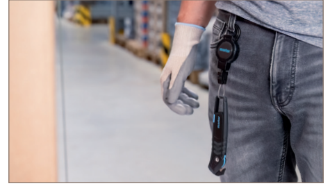
Messer im Ruhezustand.