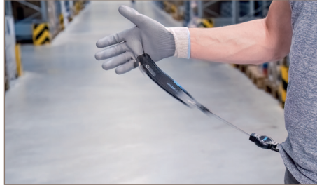
Messer im Moment des Loslassens.