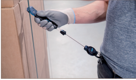
Messer im Einsatz.