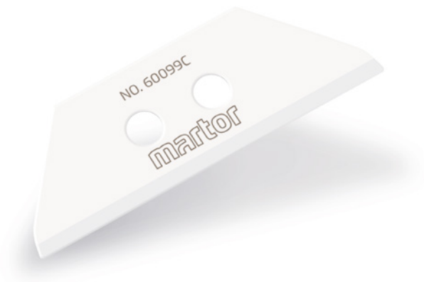
KERAMIKKLINGE NR. 60099C

Die neue KERAMIKKLINGE NR. 60099C können Sie je nach Schneidanwendung und Präferenz u.a. anstelle der TRAPEZKLINGE NR. 99 und der TRAPEZKLINGE NR. 60099 verwenden. Wie ihre Pendants aus Stahl ist auch die KERAMIKKLINGE NR. 60099C 2-fach nutzbar.